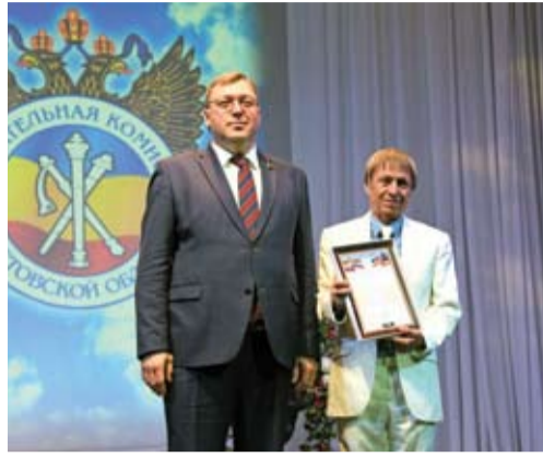
Грамоты от имени Законодательного собрания вручил Председатель ЗС РО А. Ищенко

«Ни один закон, ни один регламент или протокол не устанавливает обязанность для системы избирательных комиссий, после проведения какой-либо кампании, собирать совместно представителей избиркомов всех уровней. И я хотел бы поблагодарить нынешний состав Избирательной комиссии Ростовской области, что такая традиция у нас существует. Результаты деятельности избирательной системы на Дону имеют высокую общественную оценку еще и потому, что организаторы выборов четко и ясно понимают важность человеческого фактора, — отметил Александр Ищенко, напомнив, что никаких сколько-нибудь серьезных претензий к организации выборов Президента России в Ростовской области не было.